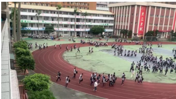
班導師帶領學生逃生疏散演練