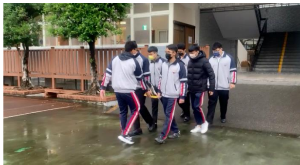
演練發現傷患通知救護班前往救援