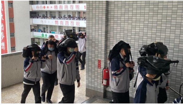
學生樓梯間移動遵循不推、不跑、不語三原則