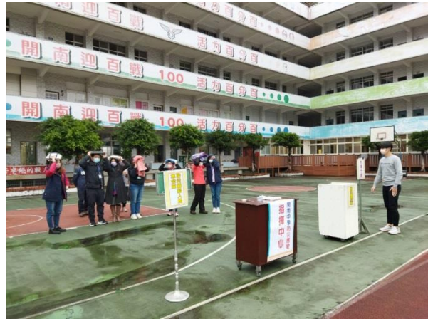
教職員室外疏散集合演練