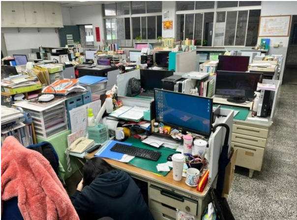
教職員室內避難演練